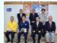
沖縄県警本部長よりトロフィーを授与された宮島警察長（前列左から 2 人目）